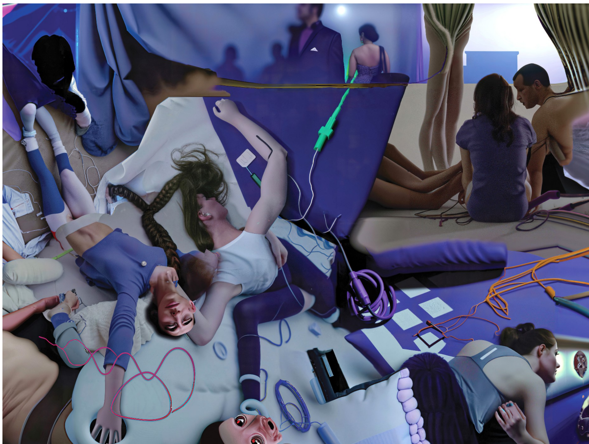
Figure 7: Grégory Chatonsky, Logistics : The Dream Surface (06/2022) Image générée avec Dall-E 2.

Voici un extrait d'un roman que j'ai écrit en mars 2020 14 , mais il faudrait mettre en suspend le « je », comme vous le verrez :