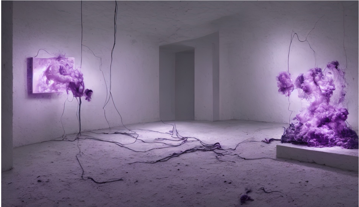
Figure 1: Grégory Chatonsky, Purple Cave (04/2022). Image générée avec Disco Diffusion.

Ce texte proposera de déconstruire la manière dont une partie non négligeable des sciences humaines envisage aujourd'hui l'intelligence artificielle (IA) en critiquant les préjugés et l'opacité de fonctionnement de la dénommée « boîte noire ». Il s'agira donc d'une réflexion au troisième degré. Il y aurait un phénomène technologique, l'IA, la critique de celui-ci et enfin la déconstruction de la critique du phénomène. Il ne faut pas entendre cette dernière comme une métacritique qui surplomberait l'ensemble des discours pour en régler les différends, mais telle une tentative pour analyser la boîte noire de l'IA comme une organisation de l'espace et de la lumière, c'est-à-dire comme une topologie et une photologie qui ne sont pas sans conséquence rétroactive sur le phénomène IA tant elles en nourrissent l'imaginaire et la genèse.