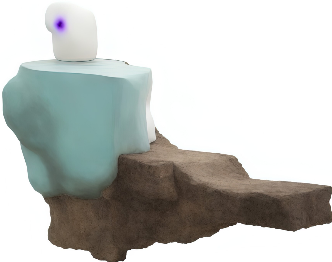
Figure 3: Grégory Chatonsky, Latent Shapes (09/2022). Image générée avec Stable Diffusion.

projection mimétique de l'être humain. L'IA est alors un masque anthropologique en miroir dont nous nous tendons le reflet.