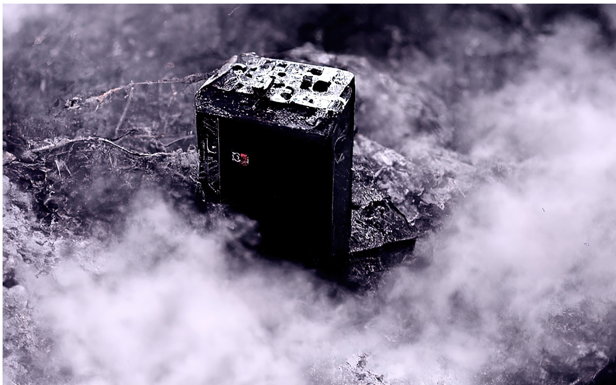
Figure 2: Grégory Chatonsky, Black Box (05/2022). Image générée avec Disco Diffusion.

Dans le champ des sciences humaines, un consensus semble avoir émergé ces dernières années autour de l'analyse de l'IA. Elle est critiquée au titre de 3 trois arguments principaux :