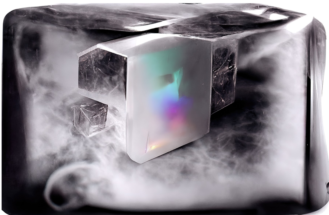
Figure 4: Grégory Chatonsky, White Cube (05/2022). Image générée avec Disco Diffusion.

J'aimerais à présent ouvrir la possibilité que cette photo-topologie puisse répondre, point par point, à une autre, celle du cube blanc de la galerie, du musée et de l'atelier de l'artiste : boîte et cube, noir et blanc donc. La fermeture nocturne laisserait place à une ouverture lumineuse et, pour tout dire, à une forme de transparence. Quelles sont les caractéristiques de ce second espace et, au-delà de la tension des formes et des couleurs, existe-t-il un argument à ce rapprochement anachronique ? Pour répondre à cette question, je développerais les caractéristiques de ce cube blanc telles que Brian O'Doherty les conceptualise dans White Cube. L'espace de la galerie et son idéologie , traduit en français en 2008.