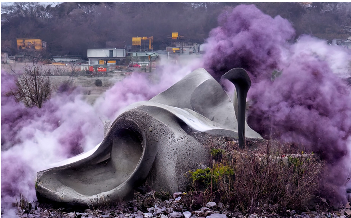
Figure 6: Grégory Chatonsky, Grey Zone (05/2022). Image générée avec Disco Diffusion.

La critique de l'opacité et des préjugés de l'IA apparaît comme une exigence démesurée adressée à une technologie pour réformer ceux de l'être humain sans le dire, dans l'objectif