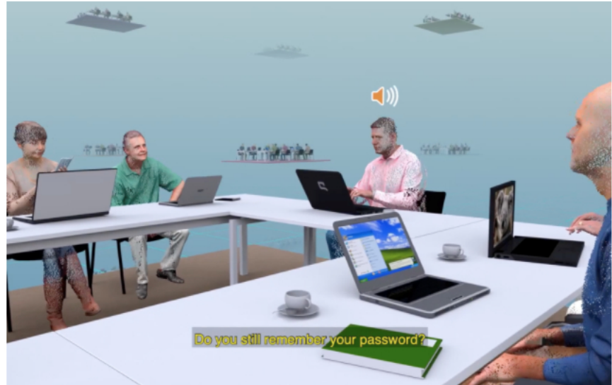
Jeroen van Loon, “New Update Available”, 2022

par Ingrid Luquet-Gad Publié le 21 janvier 2022 à 15h13 Mis à jour le 21 janvier 2022 à 15h13