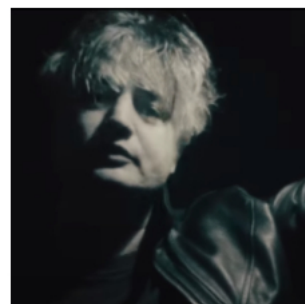
Peter Doherty s'associe à Frédéric Lo dans “You Can't Keep It From Me Forever”