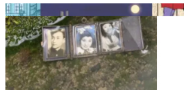
“Irradiés” de Rithy Panh : un film élégiaque et déchirant