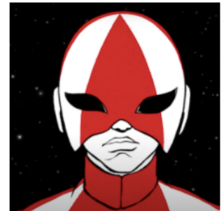
Cascadeur défie les lois de la gravité dans son nouveau clip