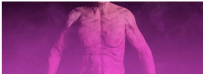
Grégory Chatonsky, "Disnovation v. 1", 2022