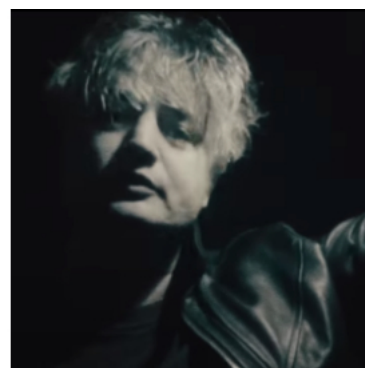
Peter Doherty s'associe à Frédéric Lo dans “You Can't Keep It From Me Forever”