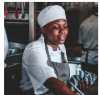
Bondire, l'association qui s'engage à faire de la restauration un milieu