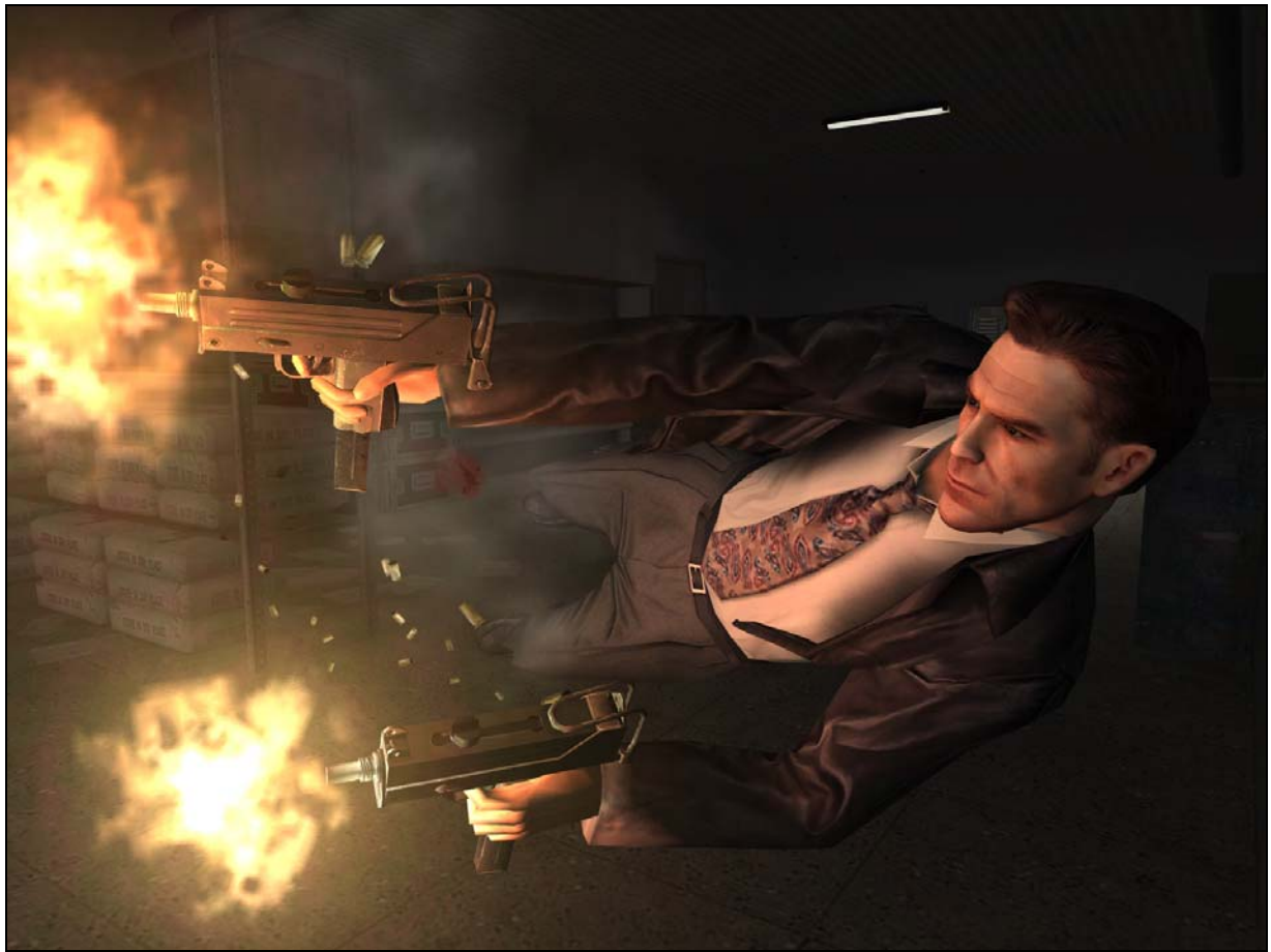
Remedy, Max Payne 2 , 2003

Une esthétique numérique serait alors à même de proposer des concepts opératoires. L'interactivité est instrumentale et sensori-motrice, on pourrait penser à la suite de Bergson, et d'une certaine manière de Kant, qu'elle est une faculté de schématiser, puisque d'une part « reconnaître un objet usuel consiste surtout à savoir s'en servir (...) Il n'y a pas de perception qui ne se prolonge en mouvement. » 39 et d'autre part « compléter la perception visuelle par une tendance motrice à en dessiner le schème. » 40 La schématisation serait une esthétique de la jouabilité. Ainsi, un jeu vidéo propose des images qui induisent chez le joueur un mouvement (de la main, du regard, du corps),